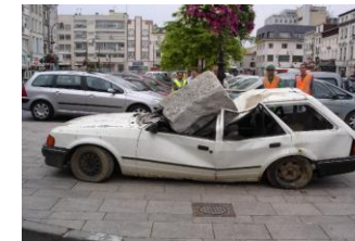
2005 : LIBRE ACCES « N'ayez pas une pierre à la place du cœur » : sensibilisation pour le respect des places réservées aux personnes handicapées