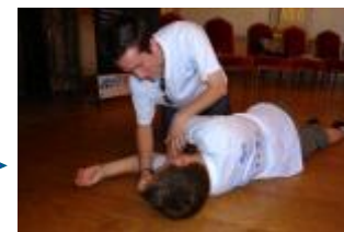
2005 / 2006 : FORM'ACTION SECOURS formation de 180 élèves à l'AFPS dans 6 établissements scolaires