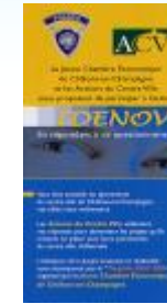
2004 – 2005 : IDENOV Enquêtes auprès des Châlonnais sur les commerces, la circulation et les loisirs et conférence-débat sur l'attractivité du centre-ville