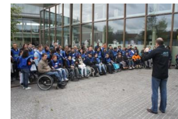
2011 : JOURNEE DE L'ACCESSIBILITE Recensement des lieux accessibles aux personnes à mobilité réduite