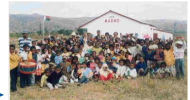
2005 : Voyage de noces humanitaire et utile à MADAGASCAR